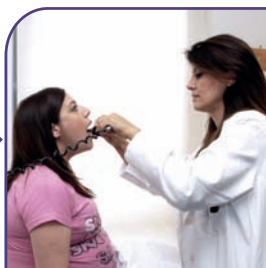
٧ زيارة الطبيب في العيادة