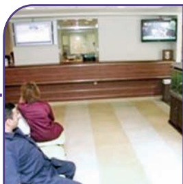
٢ قاعة الإستقبال