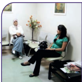
٦ قاعة الإستقبال